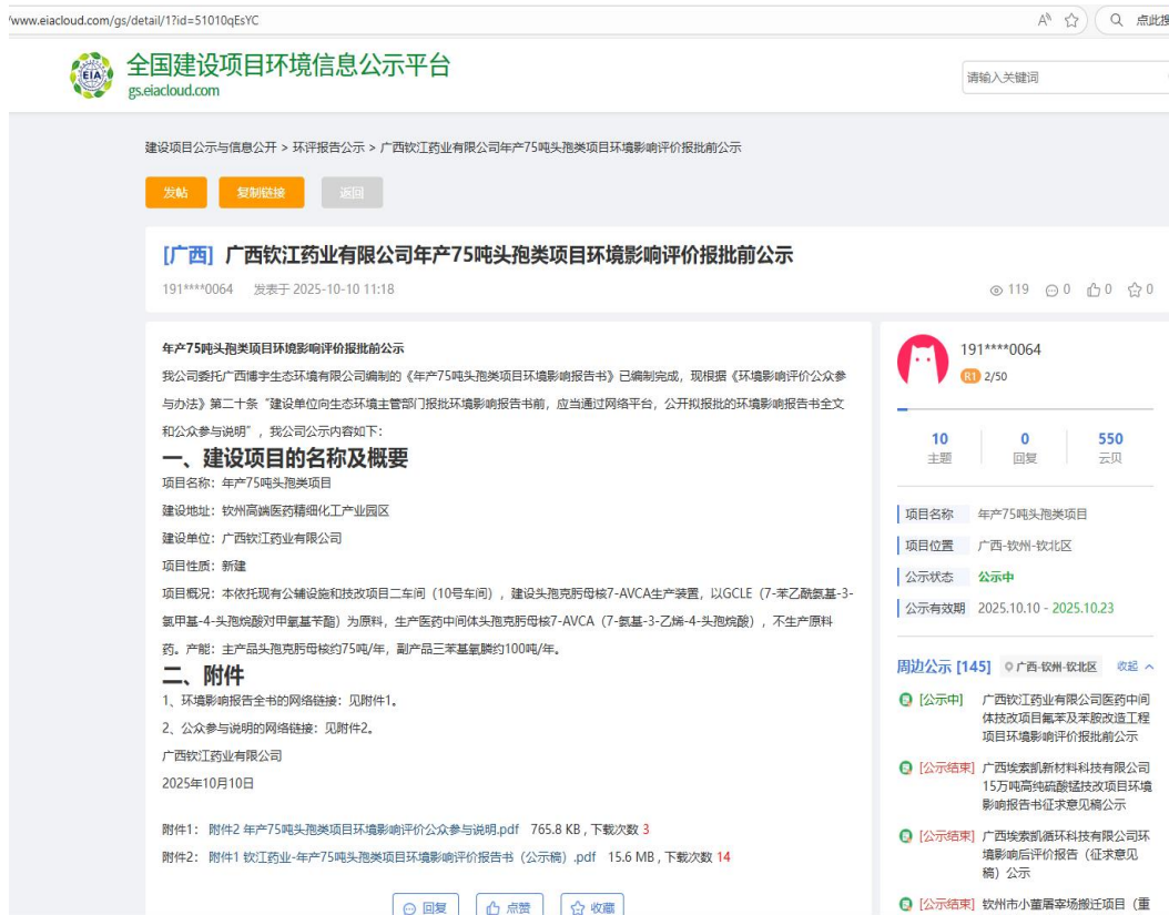
图 5.2-1 报批前公示截图