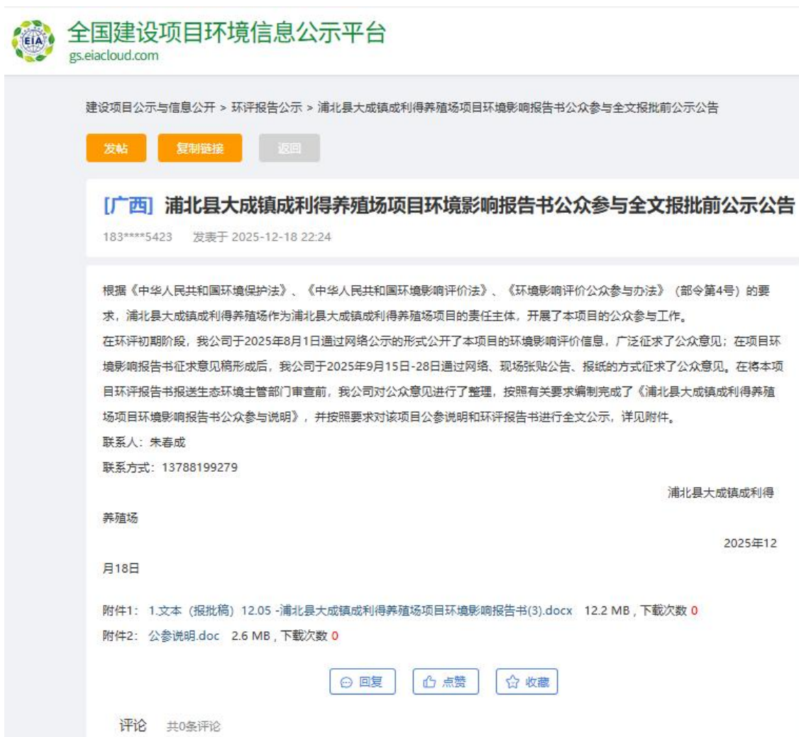
图 5 项目在全国建设项目环境信息公示平台网站报批前公示