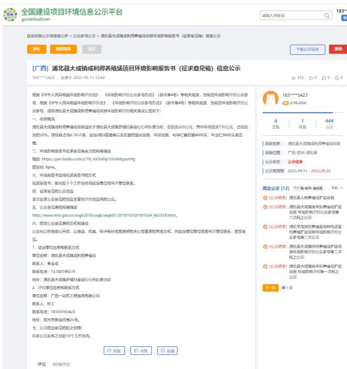
图2 项目在全国建设项目环境信息公示平台网站的第二次公示