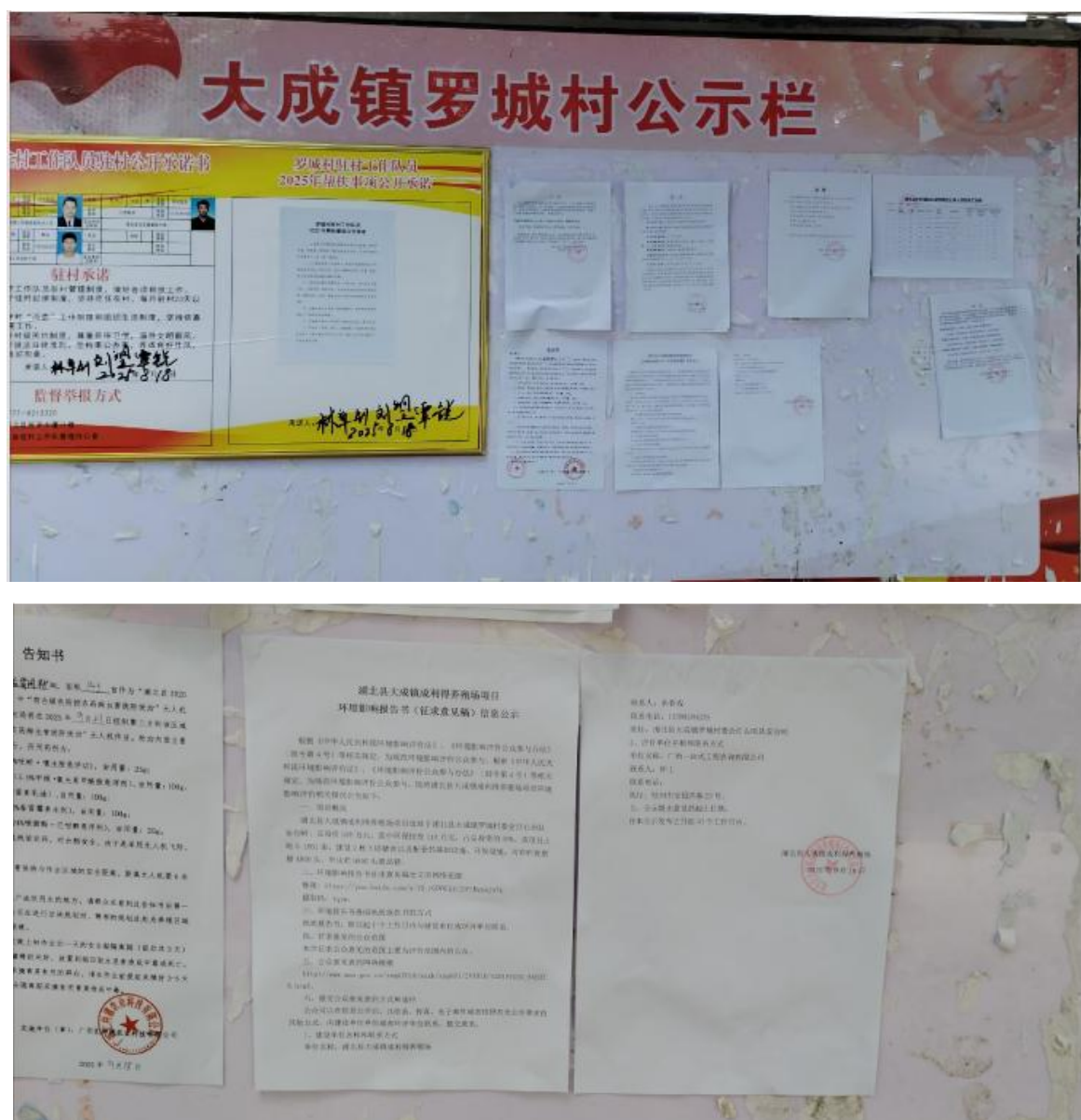
图 4 第二次信息敏感点公示照片