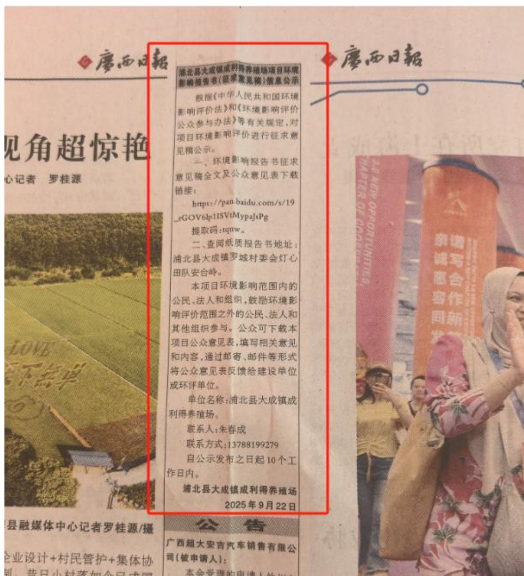
(第二次报纸公示, 2025. 9. 22)